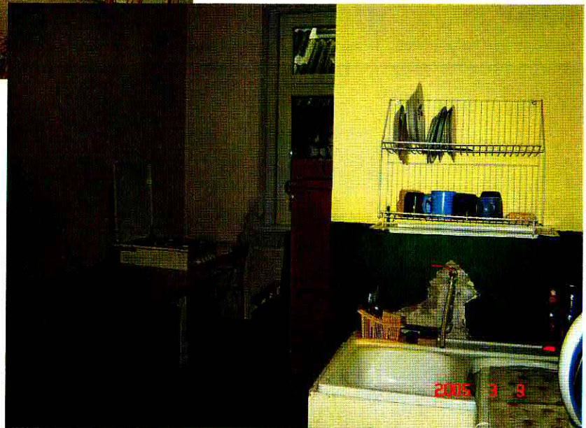
Pomieszczenia świetlicy wiejskiej