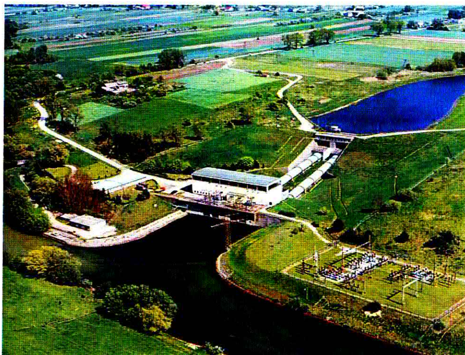
Fot. Elektrownia wodna w Samociążku